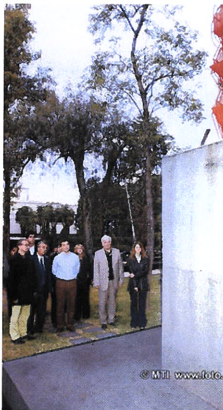
A miniszterelnök megkoszorúzza az emlékművet

Az emlékművet 2000. május 19-én, a magyar millennium alkalmából emelték a mexikóvárosi magyar nagykövetségtől nem messze fekvő Magyar Hősök Kertjében (Jardín de los próceres húngaros).